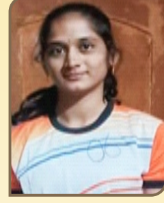
ರಾಣಿಚನ್ನಮ್ಮ ವಿಶ್ವ ವಿದ್ಯಾಲಯಕ್ಕೆ ಕಬಡ್ಡಿ ಬಲ್ಲ