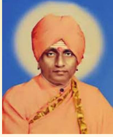
H.H. Shri Banthanal Swamiji