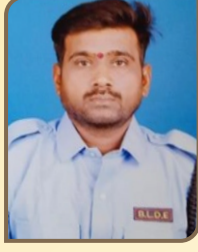
ಶ್ರೀ ವಿನಾ ವಿನಾ ವಿನಾಯಾಚಾರ್ಯ ಕಾವಲುಗಾರರು