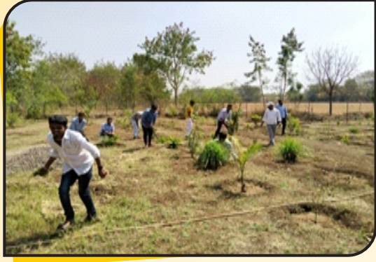
ಎನ್ ಎಸ್ ಎಸ್ ಕಾರ್ಯ