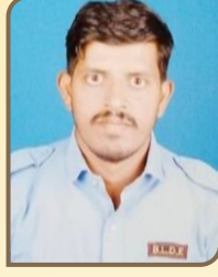
ಶ್ರೀ ವಿನಾ ಸಿ ಕನ್ನ ಕಾವಲುಗಾರರು