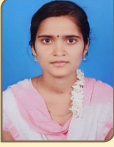
ರಾಣಿಚನ್ನಮ್ಮ ವಿಶ್ವ ವಿದ್ಯಾಲಯಕ್ಕೆ 6 ನೇ ರ್ಯಾಂಕ